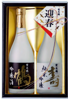
KJ-30 純米吟醸・吟醸酒 720ml詰 税込 3,630円 2本化粧箱入 (本体価格 3,300円)