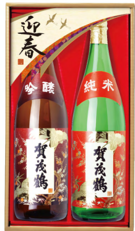
KS-5D 吟醸酒・純米酒 1.8ℓ詰 税込 5,500円 2本化粧箱入 (本体価格 5,000円)