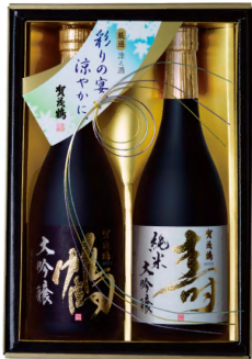
SKJ-50 純米大吟醸・大吟醸 720ml詰 税込 5,500円 2本化粧箱入 (本体価格 5,000円)