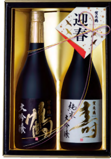
KJ-50 純米大吟醸・大吟醸 720ml詰 税込 5,500円 2本化粧箱入 (本体価格 5,000円)