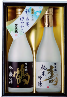
SKJ-30 純米吟醸・吟醸酒 720ml詰 税込 3,630円 2本化粧箱入 (本体価格 3,300円)