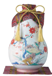
大吟醸原酒 豪華賀茂鶴 瓢箪型 1.8ℓ 税込 330,000円 (本体価格 300,000円)