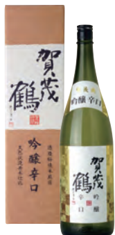
LG-A1 1.8ℓ 税込 3,630円 1本化粧箱入 (本体価格 3,300円)

●商品サイズ 115×115×410 mm ●ケース 段ボール 6本入 ●ケースサイズ 235×350×440 mm