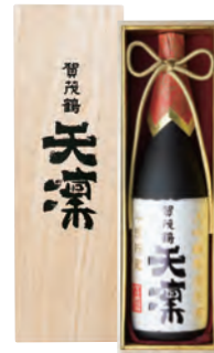
1.8ℓ 税込 33,000円 1本木箱入 (本体価格 30,000円)

●商品サイズ 455×154×122 mm ●ケース 段ボール 1本輸送箱入 ●ケースサイズ 130×162×470 mm