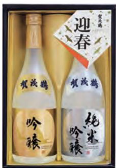
KJ-30 純米吟醸・吟醸酒 720ml詰 税込 3,630円 2本化粧箱入 (本体価格 3,300円)