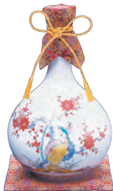
大吟醸原酒 別製豪華賀茂鶴 徳利型 1.8ℓ 税込 385,000円 (本体価格 350,000円)