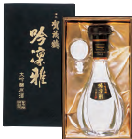
大吟醸 賀茂鶴 吟凜雅 900ml 税込 27,500円 1本化粧箱入 (本体価格 25,000円)