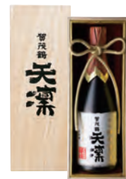
720ml 税込 16,500円 1本木箱入 (本体価格 15,000円)

●商品サイズ 335×136×106 mm ●ケース 段ボール 1本輸送箱入 ●ケースサイズ 118×147×345 mm