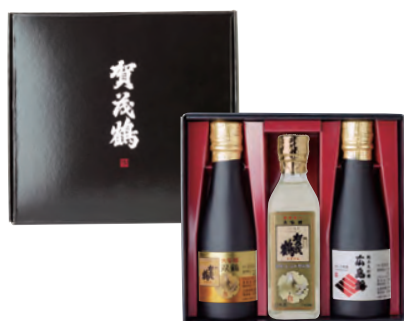
BK-30 180ml 3本詰め合わせ (本体価格 3,000円)

大吟醸と純米大吟醸 贅沢な180ml3本詰め合わせ 手土産や父の日などパーソナルギフトに