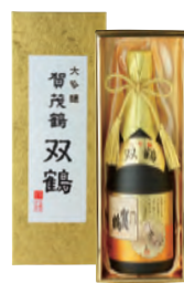
SK-B1 720ml 税込 5,500円 1本化粧箱入 (本体価格 5,000円)

●商品サイズ 315×120×100 mm ●ケース 段ボール 6本入 ●ケースサイズ 316×252×335 mm