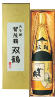
SK-A1 1.8ℓ 税込 11,000円 1本化粧箱入 (本体価格 10,000円)

●商品サイズ 447×142×114 mm ●ケース 段ボール 6本入 ●ケースサイズ 360×300×465 mm