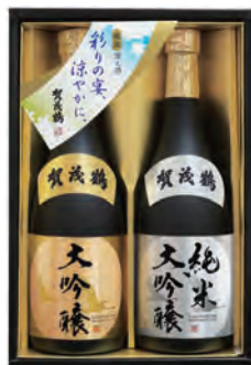
SKJ-50 純米大吟醸・大吟醸 720ml詰 税込 5,500円 2本化粧箱入 (本体価格 5,000円)