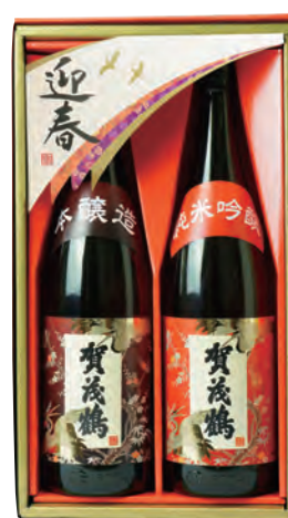
KS-5D 本醸造・純米吟醸 1.8ℓ詰 税込 5,500円 2本化粧箱入 (本体価格 5,000円)