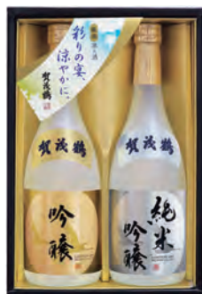
SKJ-30 純米吟醸・吟醸酒 720ml詰 税込 3,630円 2本化粧箱入 (本体価格 3,300円)