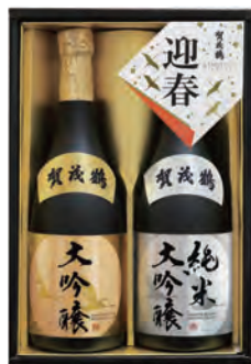
KJ-50 純米大吟醸・大吟醸 720ml詰 税込 5,500円 2本化粧箱入 (本体価格 5,000円)