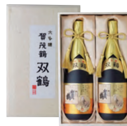
SK-B2 720ml 税込 11,000円 2本木箱入 (本体価格 10,000円)

2024・2025 ワイングラスでおいしい日本酒アワード プレミアム大吟醸部門金賞