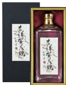
大吟醸 吉祥賀茂鶴 720ml 税込 11,000円 1本化粧箱入 (本体価格 10,000円)

●商品サイズ 245×115×90 mm ●ケース 段ボール 6本入 ●ケースサイズ 285×245×260 mm