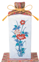
大吟醸原酒 特製豪華賀茂鶴 四角型 1.8ℓ 税込 440,000円 (本体価格 400,000円)