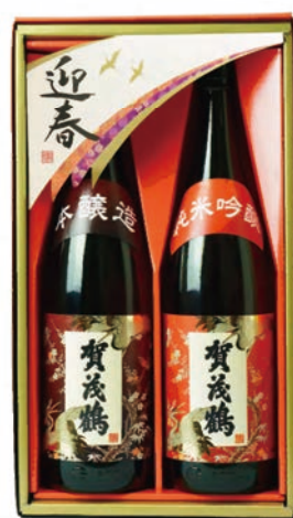
KS-5D 本醸造・純米吟醸 1.8L詰 税込 5,500円 2本化粧箱入 (本体価格 5,000円)