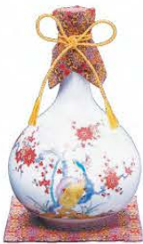
大吟醸原酒 別製豪華賀茂鶴 徳利型 1.8ℓ 税込 385,000円 (本体価格 350,000円)