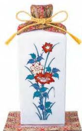
大吟醸原酒 特製豪華賀茂鶴 四角型 1.8ℓ 税込 440,000円 (本体価格 400,000円)