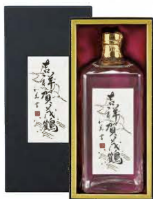
大吟醸 吉祥賀茂鶴 720mℓ 税込 11,000円 1本化粧箱入 (本体価格 10,000円)