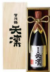
720mℓ 税込 16,500円 1本木箱入 (本体価格 15,000円)