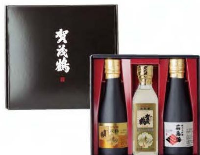
BK-30 180mℓ 3本詰め合わせ (本体価格 3,000円) 税込 3,300円

大吟醸と純米大吟醸 贅沢な180mℓ3本詰め合わせ 手土産や父の日などパーソナルギフトに