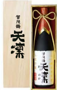
1.8ℓ 税込 33,000円 1本木箱入 (本体価格 30,000円)