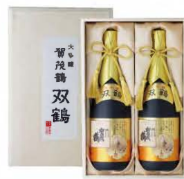
SK-B2 720mℓ 税込 11,000円 2本木箱入 (本体価格 10,000円)

2024・2025 ワイングラスでおいしい日本酒アワード プレミアム大吟醸部門 金賞