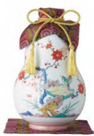
大吟醸原酒 豪華賀茂鶴 圓筒型 1.8ℓ 税込 330,000円 (本体価格 300,000円)