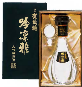
大吟醸 賀茂鶴 吟凜雅 900mℓ 税込 27,500円 1本化粧箱入 (本体価格 25,000円)