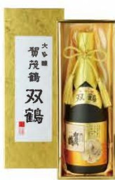
SK-B1 720mℓ 税込 5,500円 1本化粧箱入 (本体価格 5,000円)