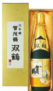
SK-A1 1.8ℓ 税込 11,000円 1本化粧箱入 (本体価格 10,000円)