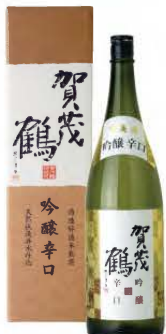
LG-A1 1.8ℓ 税込 3,630円 1本化粧箱入 (本体価格 3,300円)