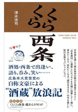
酒蔵紀行集『くらくら西条』 (ザメディアジョン刊)

1978年、東広島市西条生まれ。2004年、賀茂鶴酒造入社。2016年、中国新聞広告賞企業広告賞を受賞。現在は広報課の課長として製品のデザインや広告、PRなどに奔走する。また、自身はギター弾き語りでも活動。自社CMの酒造り歌も歌う。